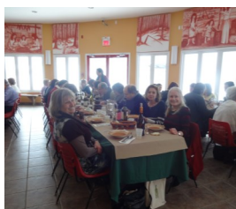
La Maison Amérindienne

Les activités dites culturelles vous seront proposées au fur et à mesure par la personne qui en sera responsable